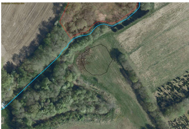
Søen på 800 m 2